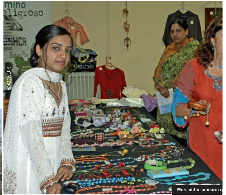
Mercadillo solidario c

La comunidad pakistání que vive en Sonseca (Toledo) ha recaudado fondos con un mercadillo solidario para los damnificados en Pakistán por las inundaciones en las que el