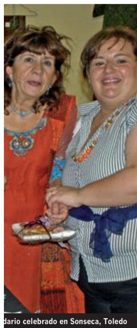
Evento celebrado en Sonseca, Toledo

de personas viven aun en tiendas de campañas y gran parte del sur del país todavía está bajo el agua contaminada. Las inundaciones han devastado la vida y los medios de sustento de la población, ya que gran parte de la población de la zona inundada se dedicaba a la agricultura y a la ganadería. El temor actual es que la crisis alimentaria se agudice, por la imposibilidad de recuperar las tierras. Además en la temporada de invierno aumentan los problemas de malnutrición y las infecciones respiratorias y dérmicas, así como la malaria, el dengue y la diarrea aguda.