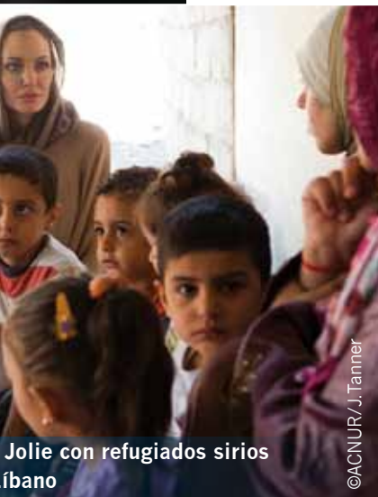
Jolie con refugiados sirios líbano

La violencia en zonas fronterizas con Sudán del Sur, incluyendo los combates en Abyei y los estados sudaneses de Kordofan del Sur y Nilo Azul, han llevado a más de 200.000 sudaneses a refugiarse en Etiopía y Sudán del Sur. ACNUR prevé más llegadas de refugiados en los próximos meses mientras continúen los enfrentamientos y se siga deteriorando la situación humanitaria en las zonas de conflicto.